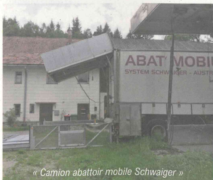
« Camion abattoir mobile Schwaiger »

Les dernières minutes d'un animal dans un abattoir classique peuvent être désastreuses sur la qualité de la viande à cause des effets du stress sur sa maturation. C'est assez dommage de travailler pendant des années pour fournir aux consommateurs une viande saine et de qualité et que ce travail soit réduit à néant par une fin de vie mal maîtrisée.